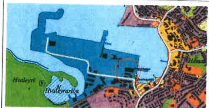
HLUTI ADALSKIPULAGS HAFNARFJARÐAR 2005-2025